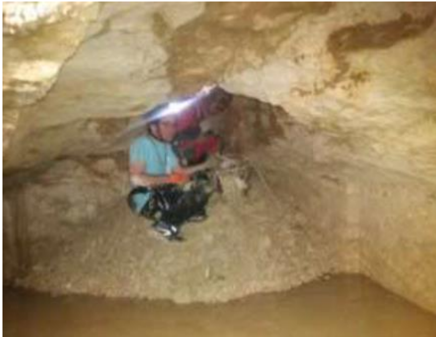
Vue de l'effondrement du 11/03/21 depuis la galerie de l'ancienne carrière souterraine, commune de Cursan

Les observations faites par les spéléologues ont conduit, par ailleurs, à souligner le prolongement des galeries au droit de la construction, sans pouvoir en déterminer l'extension précise (investigation impossible du fait de l'obturation de la galerie par un amas de matériaux). L'emprise de cette ancienne carrière, ainsi que le ou les accès, sont à ce jour non connus.