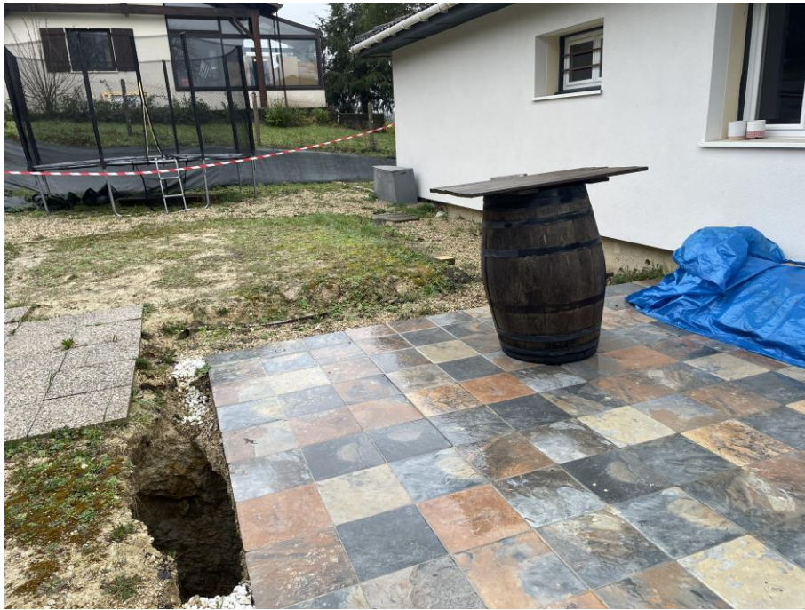
Vue de l'effondrement de terrain constaté le 11/03/21 en bordure de terrasse attenante à l'habitation, commune de Cursan