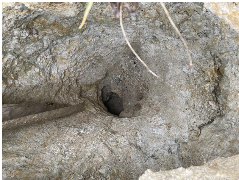
Vue vers le fond de l'effondrement de terrain constaté le 11/03/21, commune de Cursan

Cette hypothèse a été infirmée à partir des informations apportées par la reconnaissance effectuée par des spéléologues dans la cavité, accessible à partir de l'effondrement. Cette reconnaissance a permis d'identifier l'existence d'une galerie d'une ancienne carrière souterraine, non recensée sur l'inventaire départemental. L'origine du sinistre constaté le