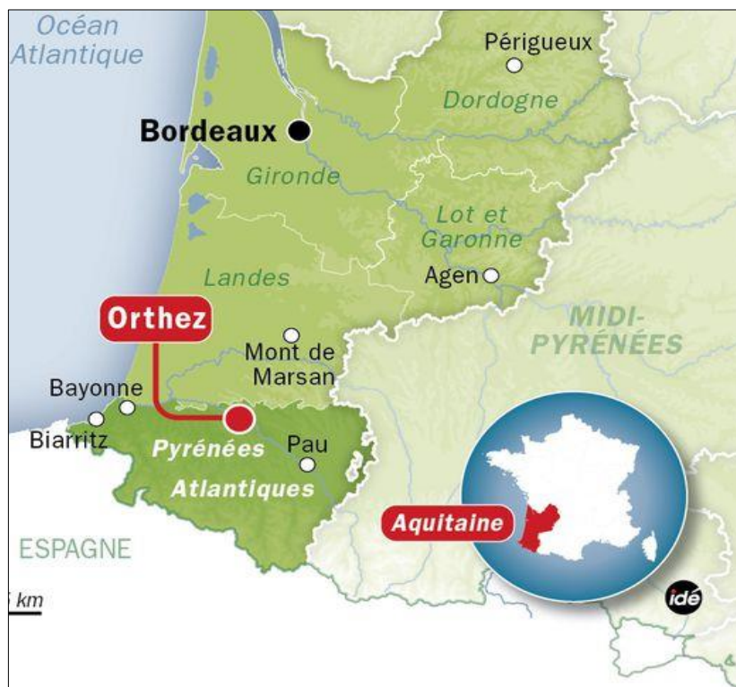
Carte 1: Localisation_Orthez.jpg

Ci-après la carte du département des Pyrénées Atlantiques sur lequel apparaît la commune d'Orthez impactée.